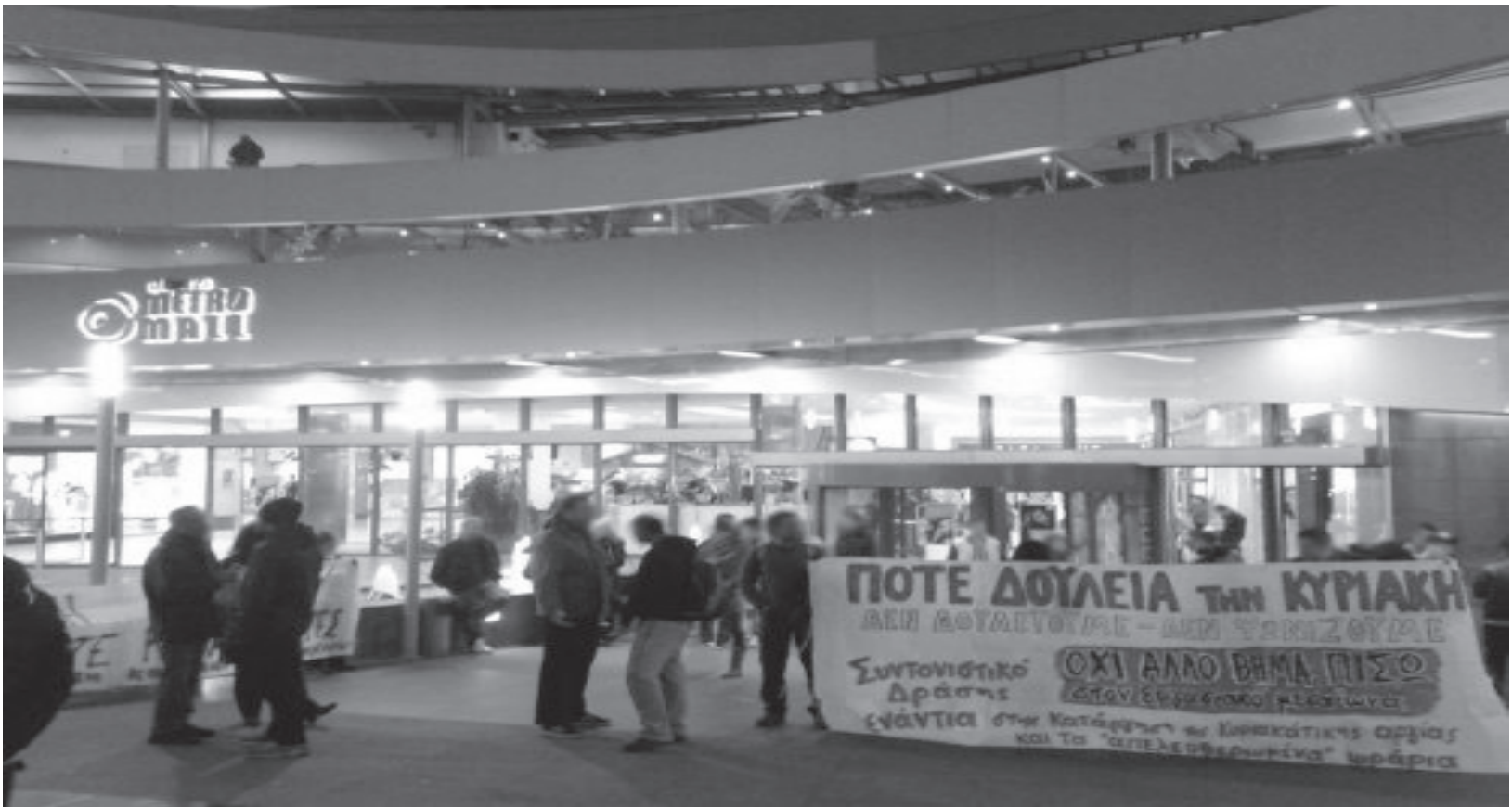
απο κινητοποίηση του Συντονισμού για τις Κυριακές στο εμπορικό κέντρο του Αγ. Δημητρίου