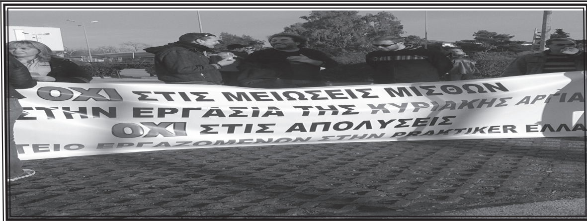
απο την 48ωρη απεργία των εργαζομένων στο ΠΡΑΚΤΙΚΕΡ και την συγκέντρωση στο υποκατάστημα του Ταύρου

Οι εργαζόμενοι πήγαν και δικαστικά κέρδισαν τα ασφαλιστικά μέτρα, κέρδισαν και το δικαστήριο, επαναπροσλήφθηκαν και αυτή τη στιγμή, 3 χρόνια μετά, ΟΙ ΕΡΓΑΖΟΜΕΝΟΙ ΕΙΝΑΙ ΜΕΣΑ ΣΤΟ ΠΡΑΚΤΙΚΕΡ ΔΟΥΛΕΥΟΥΝ ΚΑΝΟΝΙΚΑ ΧΩΡΙΣ ΤΗΝ ΜΕΙΩΣΗ ΤΟΥ ΩΡΑΡΙΟΥ ΠΟΥ ΠΗΓΑΝ ΝΑ ΕΠΙΒΑΛΛΟΥΝ.